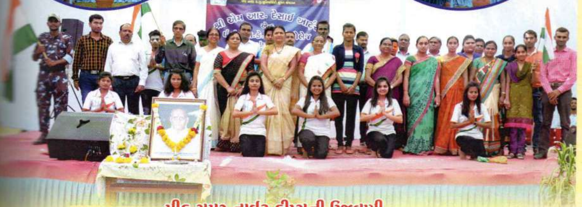
મીડ સમર નાઈટ ટ્રીસની ઉજવણી